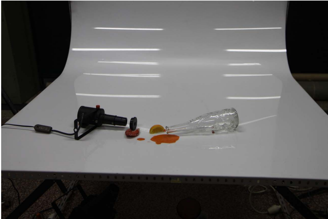
Photo 5 Une vue rapprochée du décor.