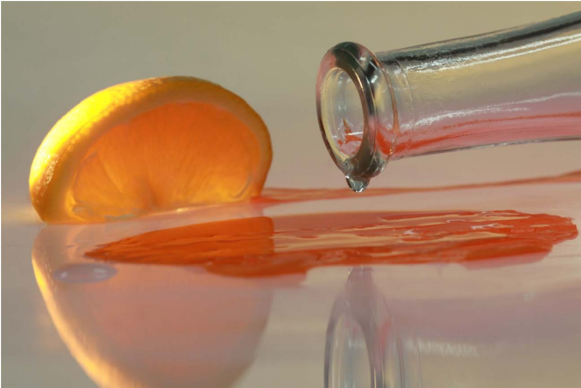
Photo 6 Composition avec l'éclairage définitif prise de vue dans le studio éclairé.